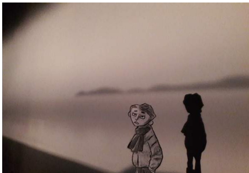
Travaux en cours