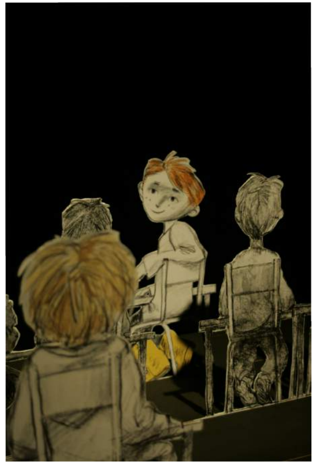
Travaux en cours

Nos recherches sont concentrées sur la sensation d'enveloppement et d'immersion du spectateur. Par le son, nous brisons la frontière entre l'espace scénique et la jauge.