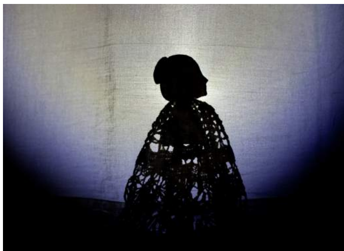
Médée la petite

Des histoires qui emplissent l'espace, laissent une empreinte et interrogent la notion de trace.