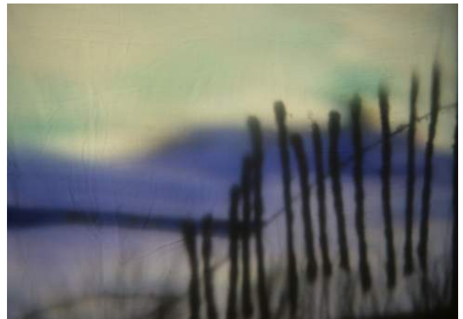
Travaux en cours

Parce que nous voulons faire alterner le sombre et le grisonnant avec le chatoyant, notre univers de référence puise ses racines dans l'esthétique des bords de mer des photographies de Harry Gruyaert .