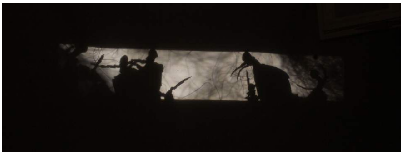
Travaux en cours

Pour ce travail, nous nous dirigeons vers les recherches de Sofie Olleval sur les minuscules qui résonnent étroitement avec nos intentions.