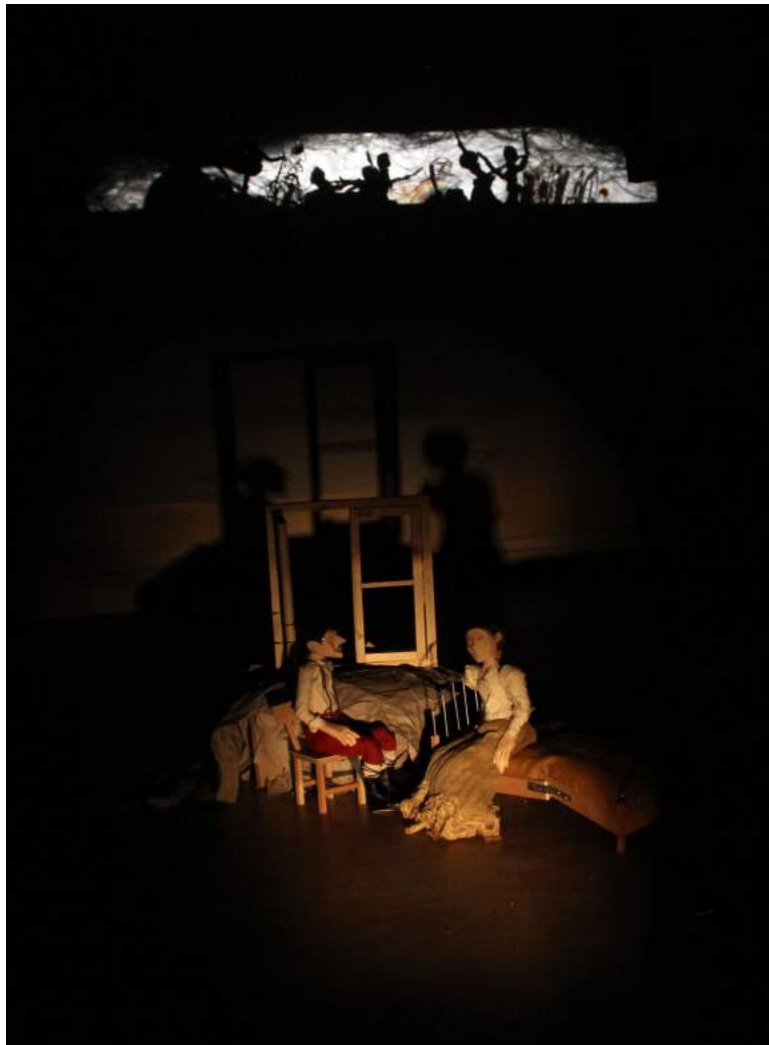
Travaux en cours

La scénographie suit cette même logique. Deux espaces de jeu se dessinent: un espace en avant scène sur une table de manipulation qui se transforme pour représenter différents décors, propices à un récit intime. Ce lieu sera successivement une chambre, une salle de bal, un peloton d'exécution. Les scènes collectives, elles, sont jouées sur un grand écran de projection d'ombres, lieu d'exposition des événements de la Grande Histoire (les tranchées, les mines de charbon ...) Ces différents espaces sont perméables et un dialogue s'y installe, comme un va-et-vient entre la guerre à l'échelle d'un homme et à celle de l'humanité.