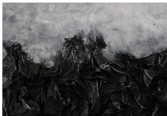
Réalisation : Sofie Olleval